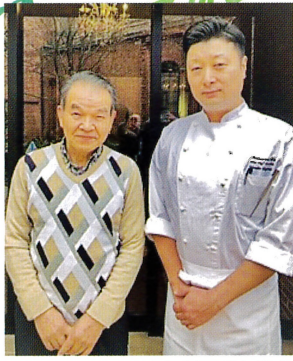
キルン料理長と筆者